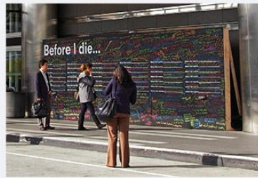
FREESTANDING PLYWOOD WALL San Francisco, CA