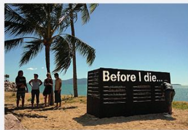
STANDALONE STRUCTURE Toowoomba, Australia

De mobiele 'Wall' van Bureau MORBidee is tevens bruikbaar als aanjager. Instellingen en organisaties (onderwijs, buurtwerk) kunnen 'm gebruiken om individuen aan te zetten tot het creëren van een 'Before I Die Wall' in de open lucht. Door een mobiele muur als voorbeeld te tonen, gaat het idee beter leven.