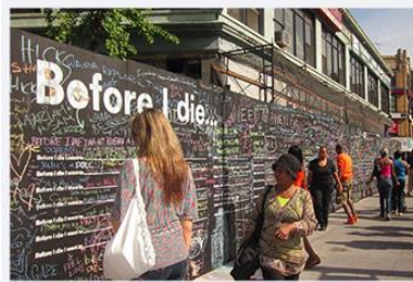
CONSTRUCTION BARRIER Brooklyn, NY