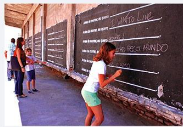
SIDE OF BUILDING Lisbon, Portugal