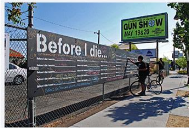
PLYWOOD ATTACHED TO FENCE Reno, NV