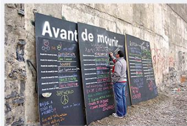
PLYWOOD LEANING AGAINST BUILDING Montreal, Canada